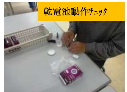
乾電池動作チェック