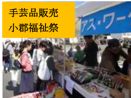
手芸品販売 小郡福祉祭