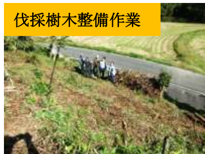
伐採樹木整備作業