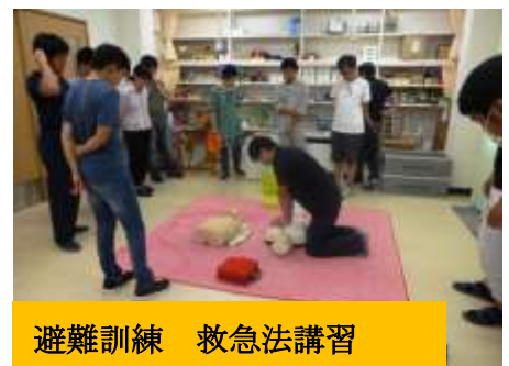
避難訓練 救急法講習