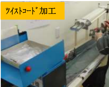
ツイストコード加工