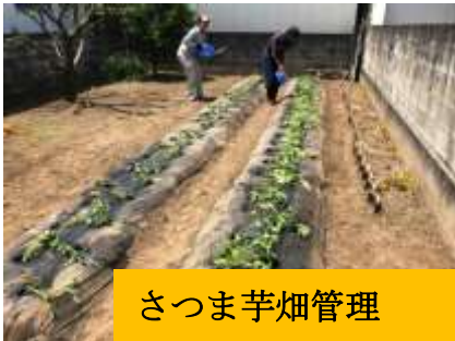
さつまいも畑管理

就労支援部門は、6月より正式に『アス・ワーク』として独立した部門となりました。2012年の就労支援部門開設以来、様々な実務作業に取り組んでまいりました。企業からの請負業務、一般家庭からの環境整備を中心とした請負作業など、年を追うごとに拡大し、連日休む暇がないほどの量となりました。開設当初は、草刈、除草、剪定など屋外作業を中心とした請負作業でしたが、通販業者からの依頼による袋詰、シール貼り、計量など手先を使った作業、自動車内のリード線の加工など、利用者の方々の特性に合わせた作業が可能となりました。猛暑、寒波という厳しい気候の中での屋外作業、大量の製品を根気強く加工・処理する室内作業、どちらにおいても利用者の方々の努力で、発注元の期待に応える成果を挙げることができました。新しい年を迎え、『継続すること』『昨日より一歩向上すること』を目指し、職員も共に努力を続けていきたいと考えています。