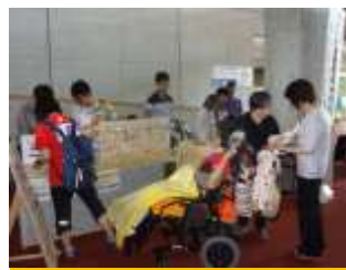
手芸品販売ポツァ全国大会