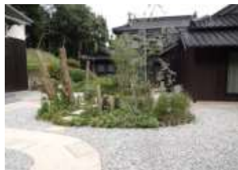
造園業の指導による庭園造り