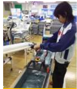
新作業ツイストボード加工