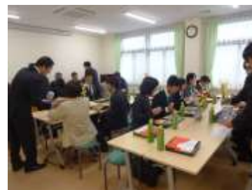
竣工式後の家族会