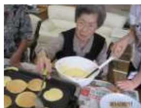
ホットケーキ作り