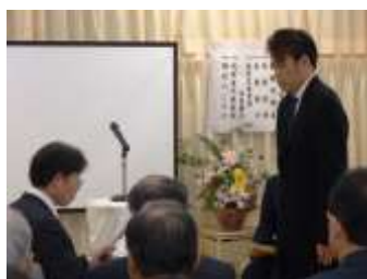
ぐこう設計・山口 建設に感謝状