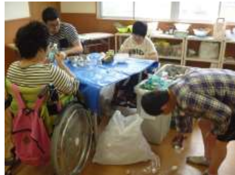
生産活動 ペットボトル演し