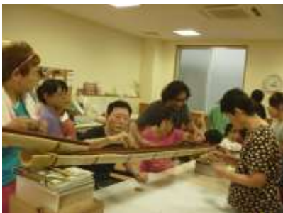
夏はそうめん流し