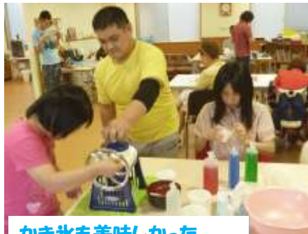
かき氷も美味しかった